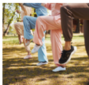
yoga | taichi