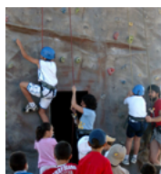
programas combinados colegios e institutos