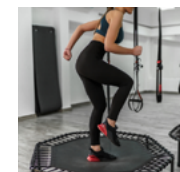
strong by zumba + jump TRX