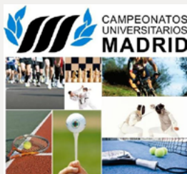
campeonatos universitarios Madrid