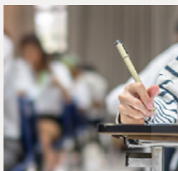
reconocimiento de créditos