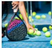
escuela de pádel