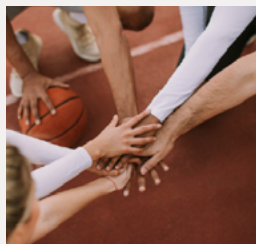
selecciones deportivas UAH